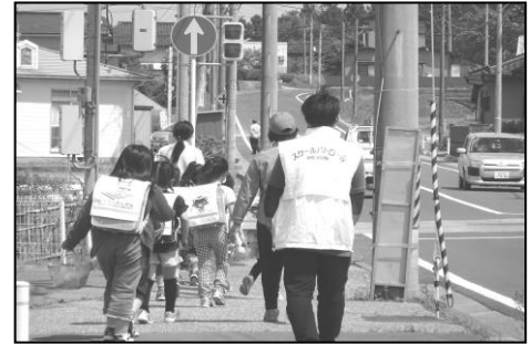
1年生の下校に付き添う「こども見守り隊」の皆さん