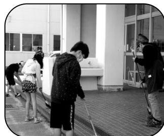
掃除を頑張る6年生