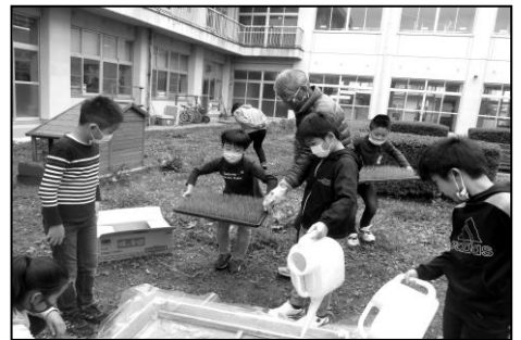
島山会長に教わりながら育苗体験をする4年生