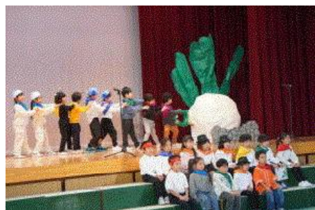
1年生 みんなで力を合わせて大きなかぶが無事ぬけました。

保護者の皆様には、衣装の準備や体調管理等への御協力いただき、ありがとうございました。