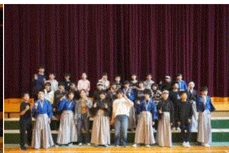
6年生 「変わらないもの」、命の尊さ、平和の大切さを力強く伝えました。