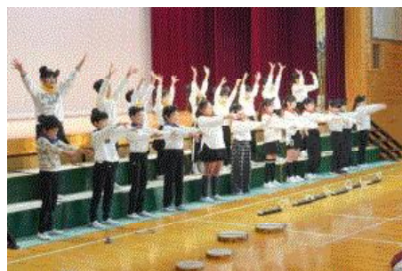
3年生 みんなで心をついて素敵な合奏、合唱を演奏できました。