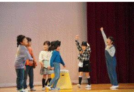
2年生 えっちゃんはすてきな帽子を力強く守りました。