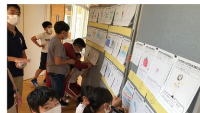
9/28 キャラクターコンテスト 児童の力作揃いです。果たして、最優秀賞は誰の手に。