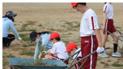
9/22 校庭の草取り 自分たちの校庭は、自分たちの手で!でも、まだ…。