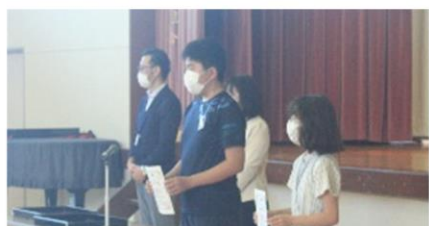
算数チャレンジの参加賞授与 最後まで諦めずに取り組みました。