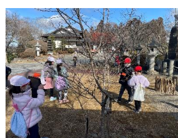
桜のつぼみもふくらんでるね！！

日本ならではの四季を、風景の変化や風の薫り、海の色や空の高さ、食べ物の違いなどたくさんのことから感じ取れることのできる日本の豊かさに感じた1年生の学習になったことでしょう。