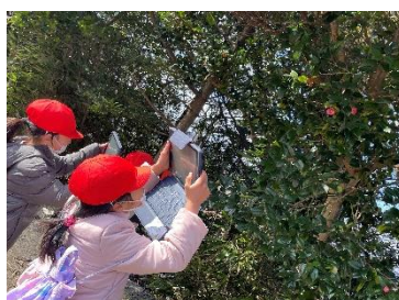
椿の花が咲いている