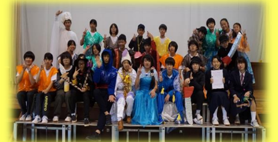
< 全校演劇 >