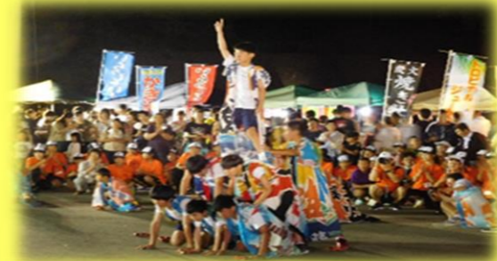
< 大島ソーラン >