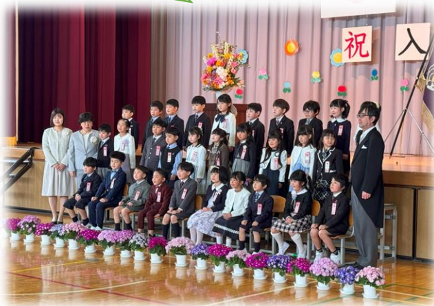
新入学児童集合写真