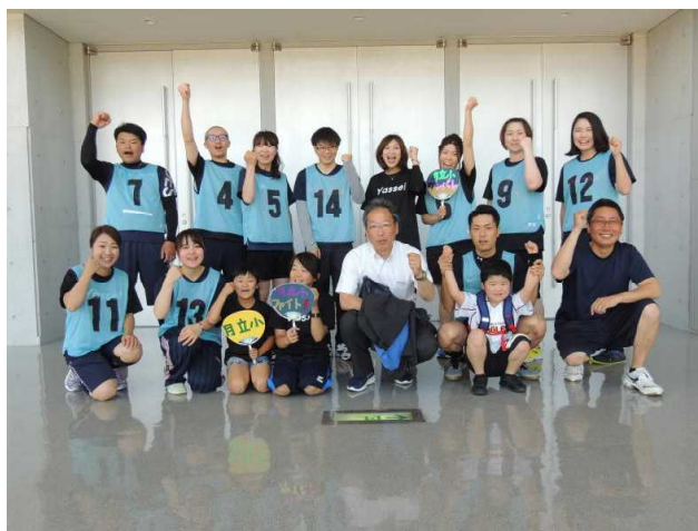
【健闘した月立小学校PTAチーム】

一昨年から校庭をドクターヘリ離着陸場(ランデブーポイント)に指定したいという要請があり、昨年末に正式に決定しました。緊急時には校庭がドクターヘリ離着陸場として使われますのでご承知おきください。