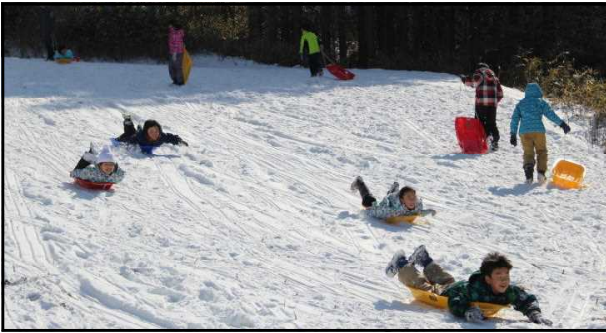
《強い心と体にいどむ子》

2月11日、3・4年生が今年最後になるであろうそり遊びを堪能しました。何度も何度もそりを引いて斜面を登り、頂上からの滑走を楽しみました。そり遊びは、スリルや楽しさを味わうだけでなく体感を鍛えることにもつながりました。