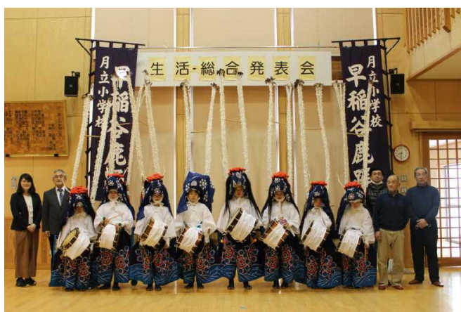
《生活・総合発表会 オープニングセレモニー》