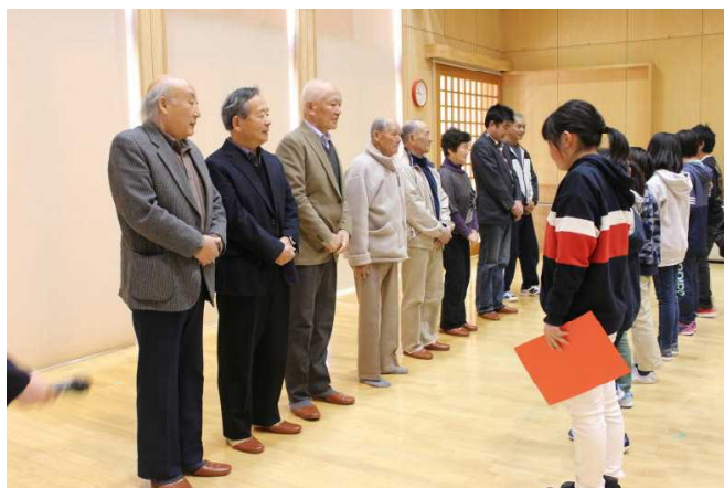
《感謝の会 お世話になった皆様方へ感謝の手紙を》