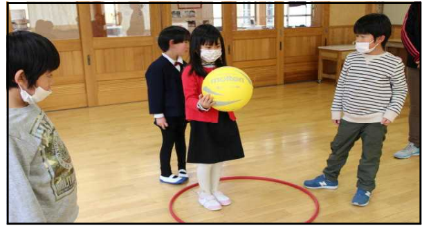
《気持ちよきはたらく子》

2月7日に、次年度の新入学児童2名を迎えて1日入学を行いました。1・2年生が事前に一緒に遊ぶ計画を立て、遊び方を教えたり、やって見せたりお世話をしてくれました。お兄さん・お姉さんとしての役割を果たす姿をとてうれしく思いました。