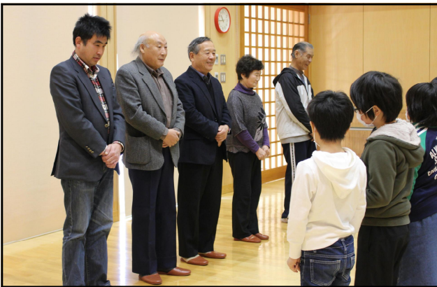
《だれにでもやさしい子》

学校を支えてくださっているそうそうたる面々。生活・総合発表会後の感謝の会でお世話になった皆様方へ、いつか自分も講師の先生方のような誰かの役に立てる人になりたいとあこがれの気持ちを込めて、感謝の手紙をお渡ししました。